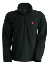
Polaire noire 100% polyester, S au XXXL