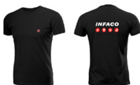
Tee-shirt noir 100% coton, S au XXXL