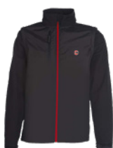
Blouson INFACO 2en1 100% polyester, S au XXXL