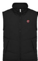
Doudoune sans manche 100% polyester, S au XXXL