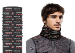
Tour de cou 100% polyester