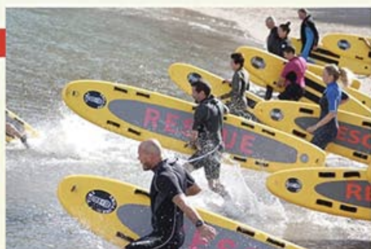
PLANCHE RESCUE ROCKET

Cette planche gonflable remplace une bouée tube ou une bouée torpille (voir page 13).