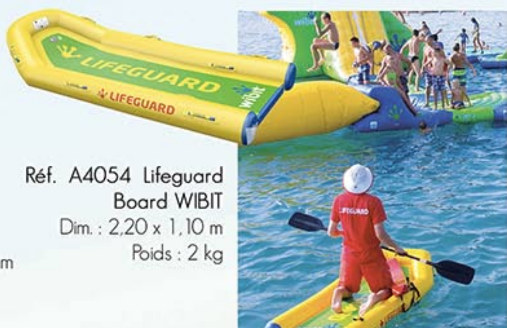
Réf. A4054 Lifeguard Board WIBIT Dim. : 2,20 x 1,10 m Poids : 2 kg