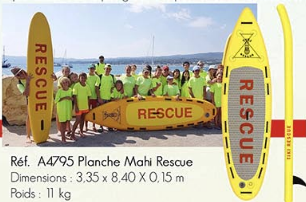
Réf. A4795 Planche Mahi Rescue Dimensions : 3,35 x 8,40 X 0,15 m Poids : 11 kg

Cette planche permet d'améliorer la surveillance aquatique et la prévention des risques grâce à la position surélevée des secouristes.