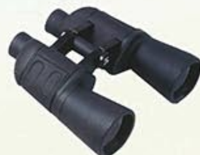
Réf. A1100 Jumelles marines 7X50 autofocus noires

Le complément du poste de secours aquatique