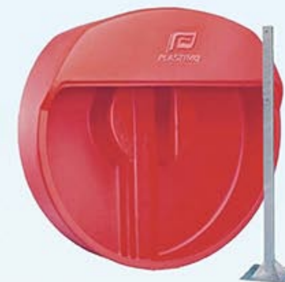
Réf. A2573 Coffre ouvert Réf. A2574 Pied pour coffre ouvert (1,5 m)