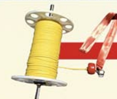
Réf. A4740-848 Touret 200m Réf. A4740-847 Touret 100m