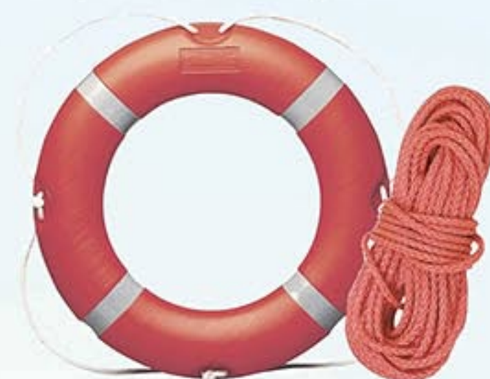
Réf. A1090 Bouée couronne SOLAS Réf. A1091 Bouée couronne + ligne de jet 30m Réf. A3387 Ligne de jet 30m - orange ou blanc

Indispensable sur les quais et au bord des rivières, bassins et plans d'eau.