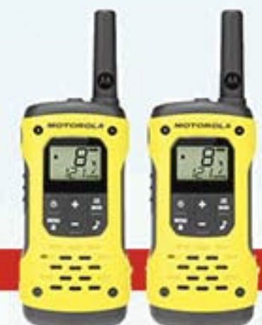
Réf. A4685 Paire de Talkie-walkies Motorola étanches Eau et Poussières