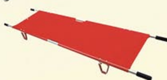
Réf. A3526 Brancard aluminium pliant en deux