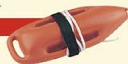
Réf. A3060 : Bouée Sauveteur Torpille

Très appréciée des maîtres-nageurs sauveteurs car très facile à emmener lorsqu'il s'agit d'aller porter secours à un baigneur en péril en nageant.