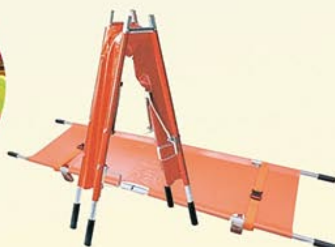
Réf. A3910 Brancard aluminium pliant en quatre