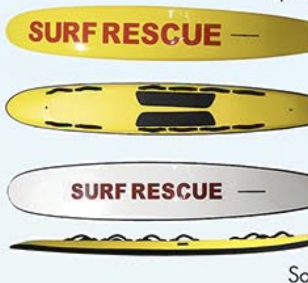
Réf. A4813 Rescue Rigide Epoxy Réf. A4814 Rescue Rigide Soft

Des planches d'intervention légères, maniables et rapides grâce à leur structure et à la qualité de leurs matériaux. Poignées et dérive inclus.