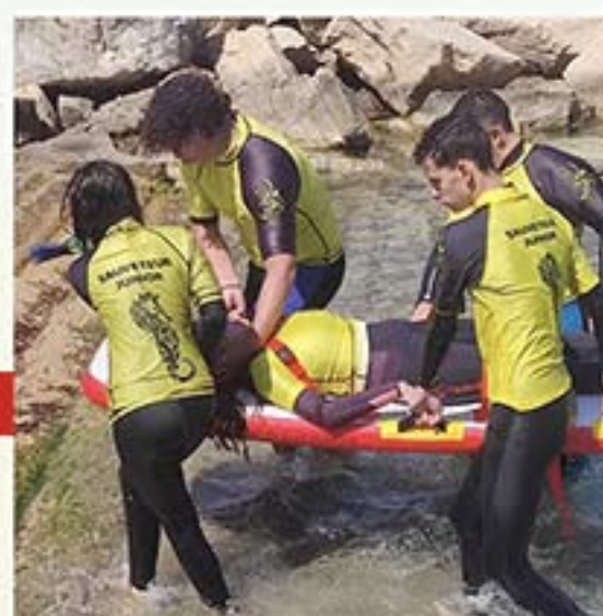
Réf. A4798 Civière plan dur gonflable 205 Dimensions : 2,20 X 1,10 X 0,10 m

La technologie Dropstitch garantit une grande résistance.