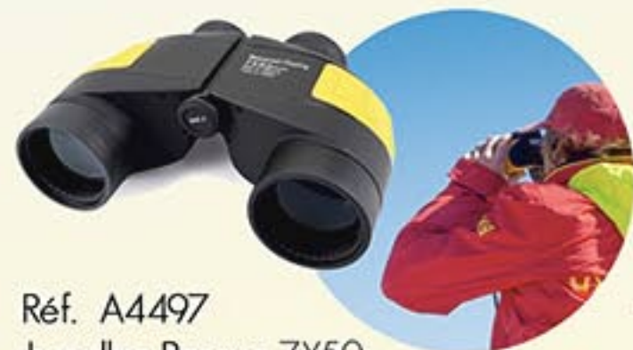
Réf. A4497 Jumelles Rescue 7X50 étanches et flottantes