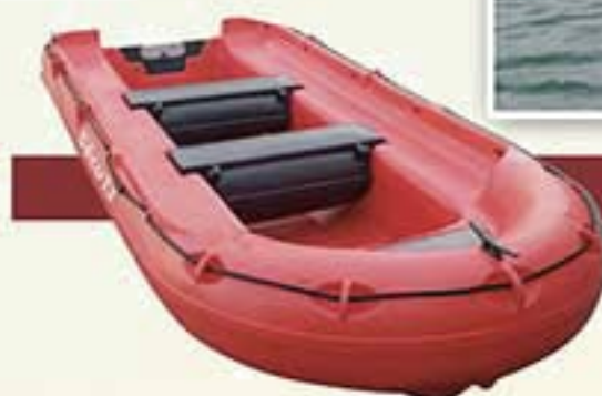
La carène en V du Sécu 13 en fait un bateau très dynamique.