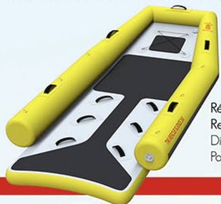
Réf. A4797 Rescue Sledge 260 Dim. : 2,65 X 1,15 X 0,10 m Poids : 17 kg

Une planche-traineau incontournable, développée en collaboration avec la SNSM et les SDIS français.