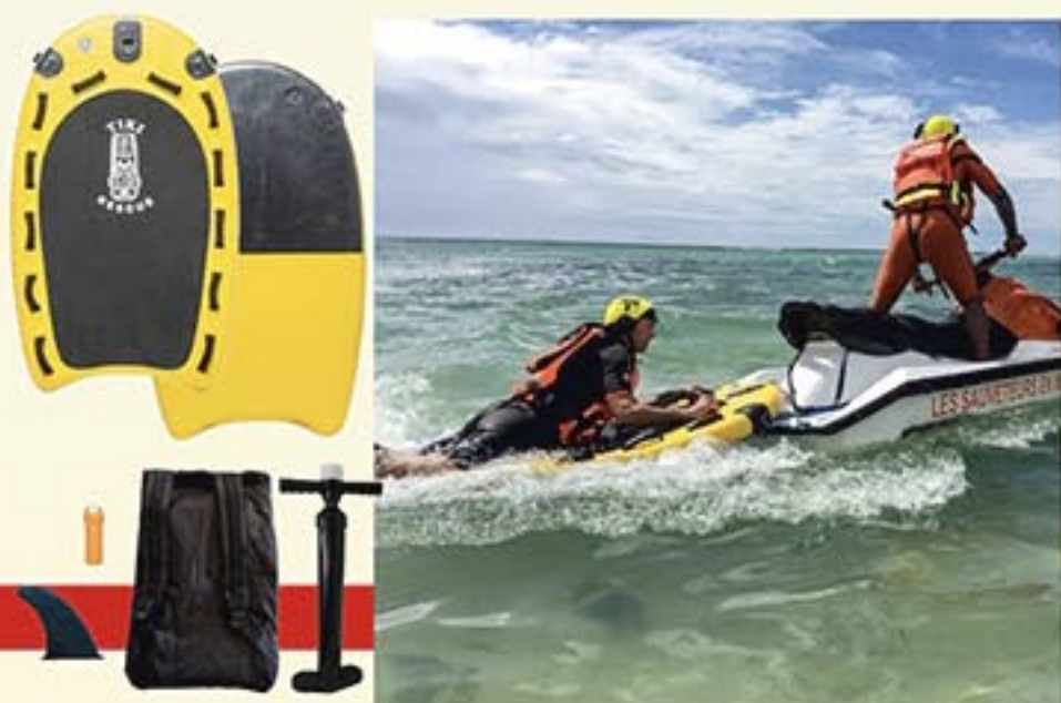
Réf. A4796 Rescue Sled pour Jet Ski Dimensions : 1,68 X 0,99 X 0,10 m Poids : 8 kg

Cette planche gonflable est arrimée à l'arrière d'un jet-ski pour sécuriser les plages. Elle permet une intervention plus rapide et un passage plus proche de la victime sans risque de la blesser.