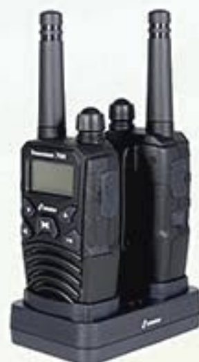
Réf. A1501 - Paire Talkies Walkies Pro + socle double chargeur + 2 accus Réf. A1501Mal - Malette Pro incluant Réf A1501 + 2 micros CB main libre + 2 adaptateurs voiture