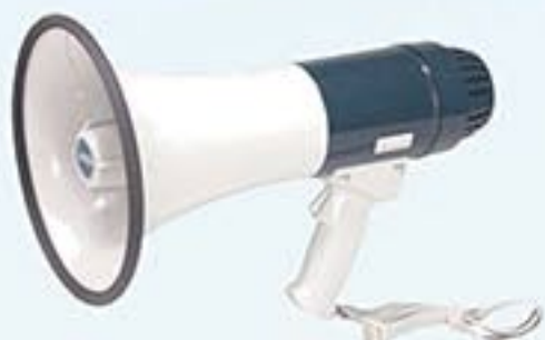
Réf. A1092 Porte voix sirène Réf. A1092 MIC option micro à main