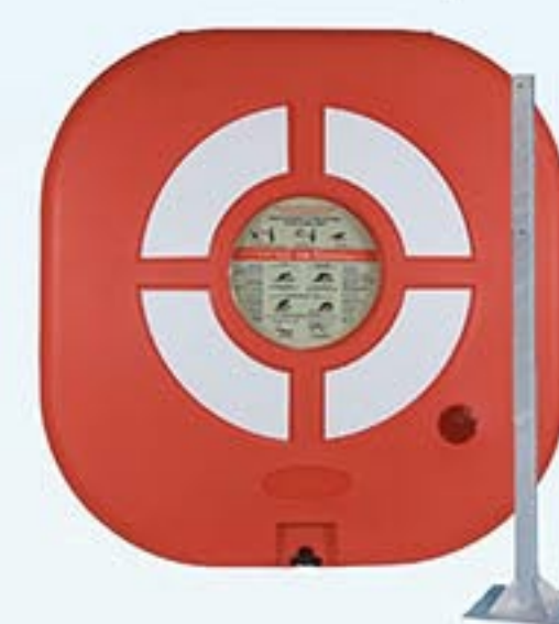
Réf. A2114 Coffre avec porte Réf. A2114P Pied pour coffre avec porte (2 m)