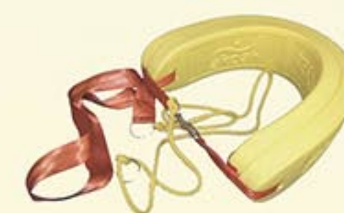
Réf. 4743-838 Ceinture en mousse souple avec harnais (approuvé ILS)