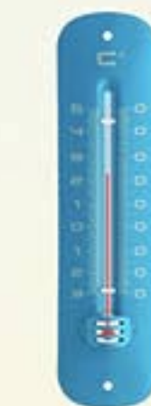
Réf. A4182 Thermomètre d'extérieur