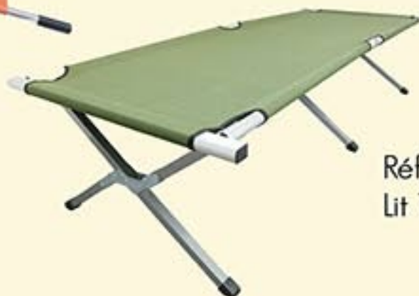
Réf. A3356 Lit Tyrol pliant