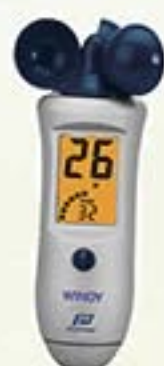
Réf. A1102NEW Anémomètre à main