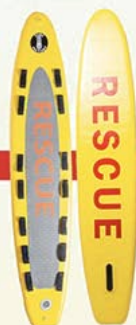
Réf. A4658 Planche Rescue 320 Dim. : 3,20 x 0,58 m Poids : 9 kg

Cette planche gonflable est originale, spécialement réalisée avec des professionnels du secours pour obtenir une planche d'intervention légère, rapide, fiable et parfaitement ergonomique