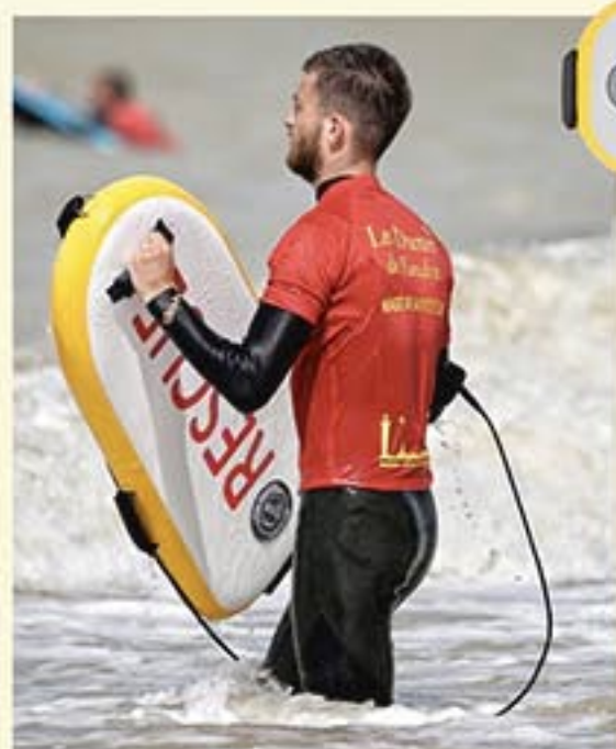
Réf. A4794-810 Planche Rescue Rocket Dim. : 0,98 x 0,43 X 0,10 m Poids : 2 kg

Cette planche gonflable remplace une bouée tube ou une bouée torpille (voir page 13).