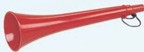
Réf. A1256 Corne de Brume