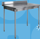
Table inox 2€/j*