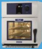
Four 6 niveaux 19€/j*