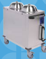
Chariot assiettes chauffant 7€/j*