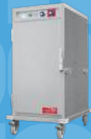
Etuve remise en température 11€/j*